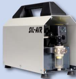
SIL-AIR 20 A Art.-Nr. 900 205