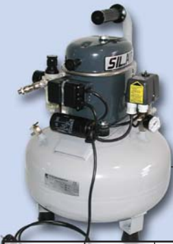
SIL-AIR 50/24 Art.-Nr. 900 274