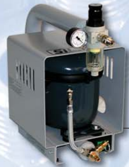
SIL-AIR Export C Art.-Nr. 900 220

Änderungen vorbehalten – alle Angaben gem. Hersteller