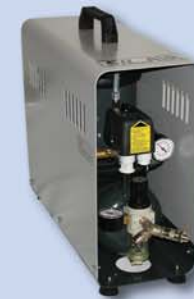
SIL-AIR 30 D Art.-Nr. 900 310