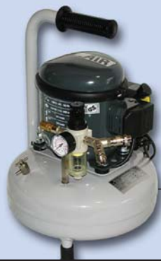
SIL-AIR 30/9 Art.-Nr. 900 260